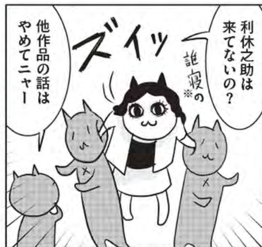
※モーニング連載中「誰も寝てはならぬ」に出てくるロシアンブルー